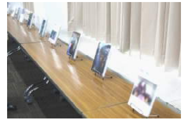
「1冊目の自伝を作る」ワーク